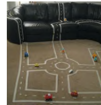
Gwneud lon geir gyda tap.