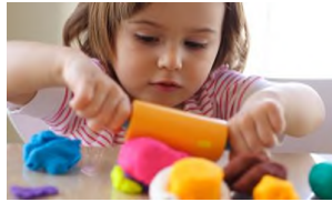
Chwarae efo Clai