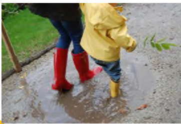
Neidio mewn pyllau