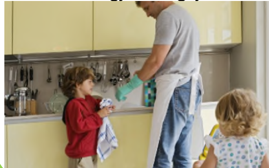
Gweithio gyda'ch gilydd