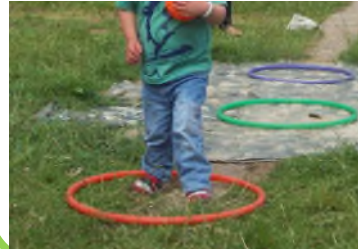
Neidio Hula Hbop