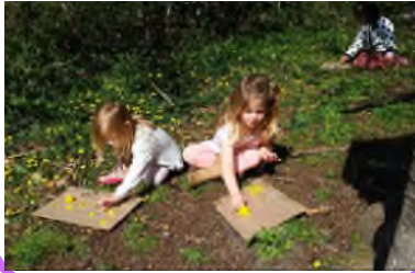
Gwneud celf nat ur