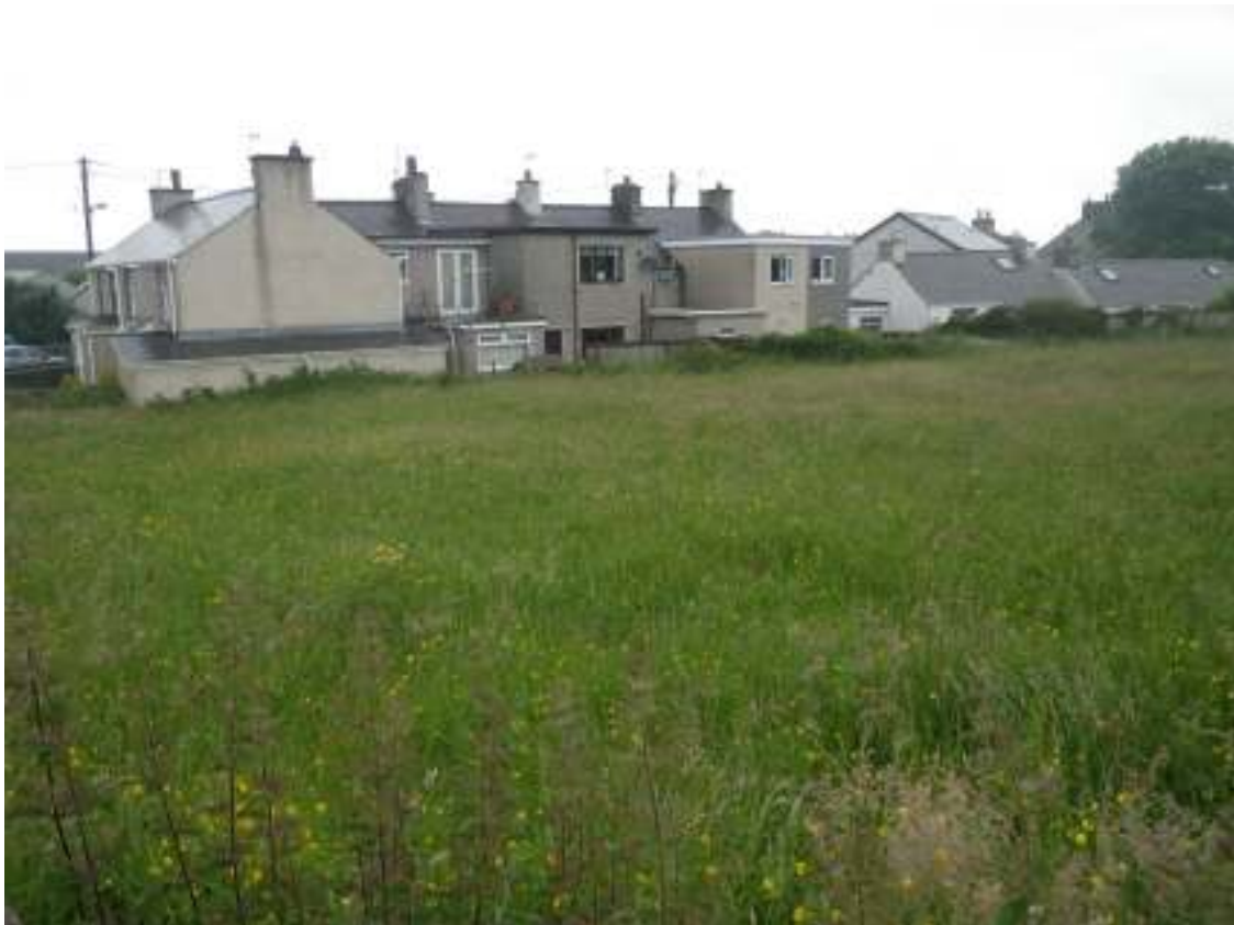
T58 Cae 1 ger y lôn