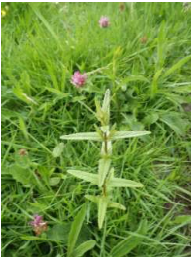
T58 cae 2 Cribell felen