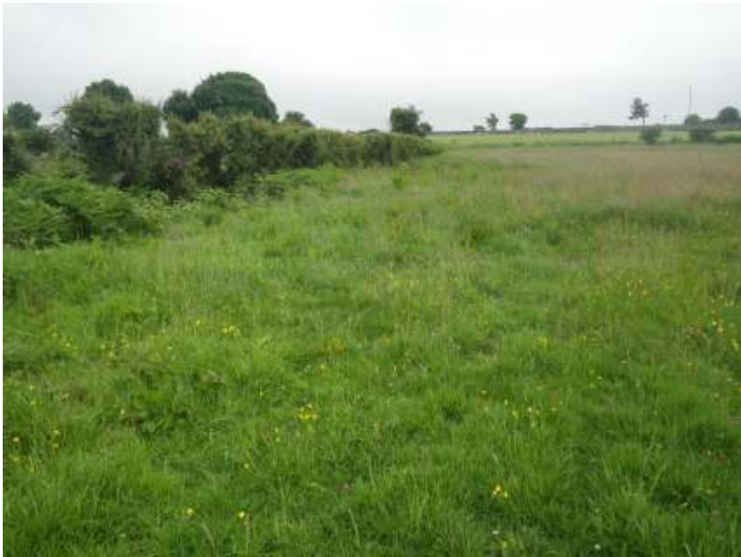
T58 Cae 2