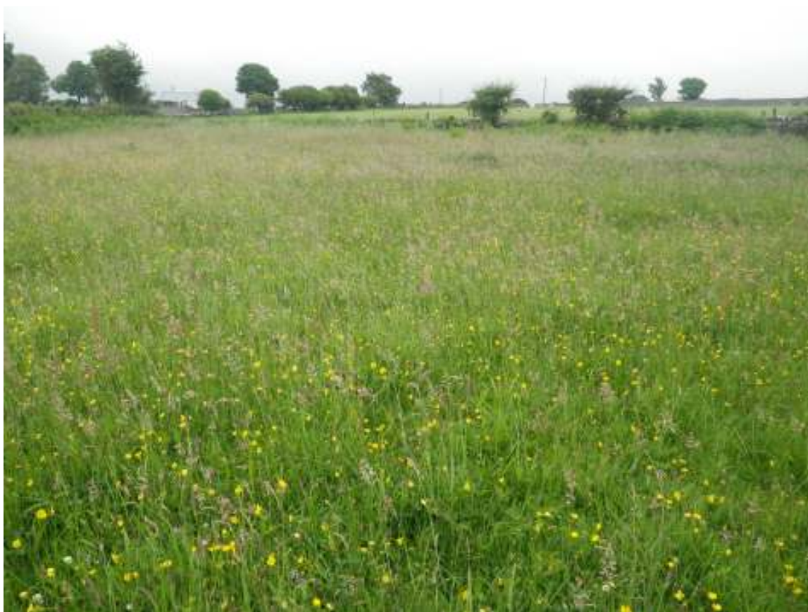
T58 Cae 2 (canol cae)