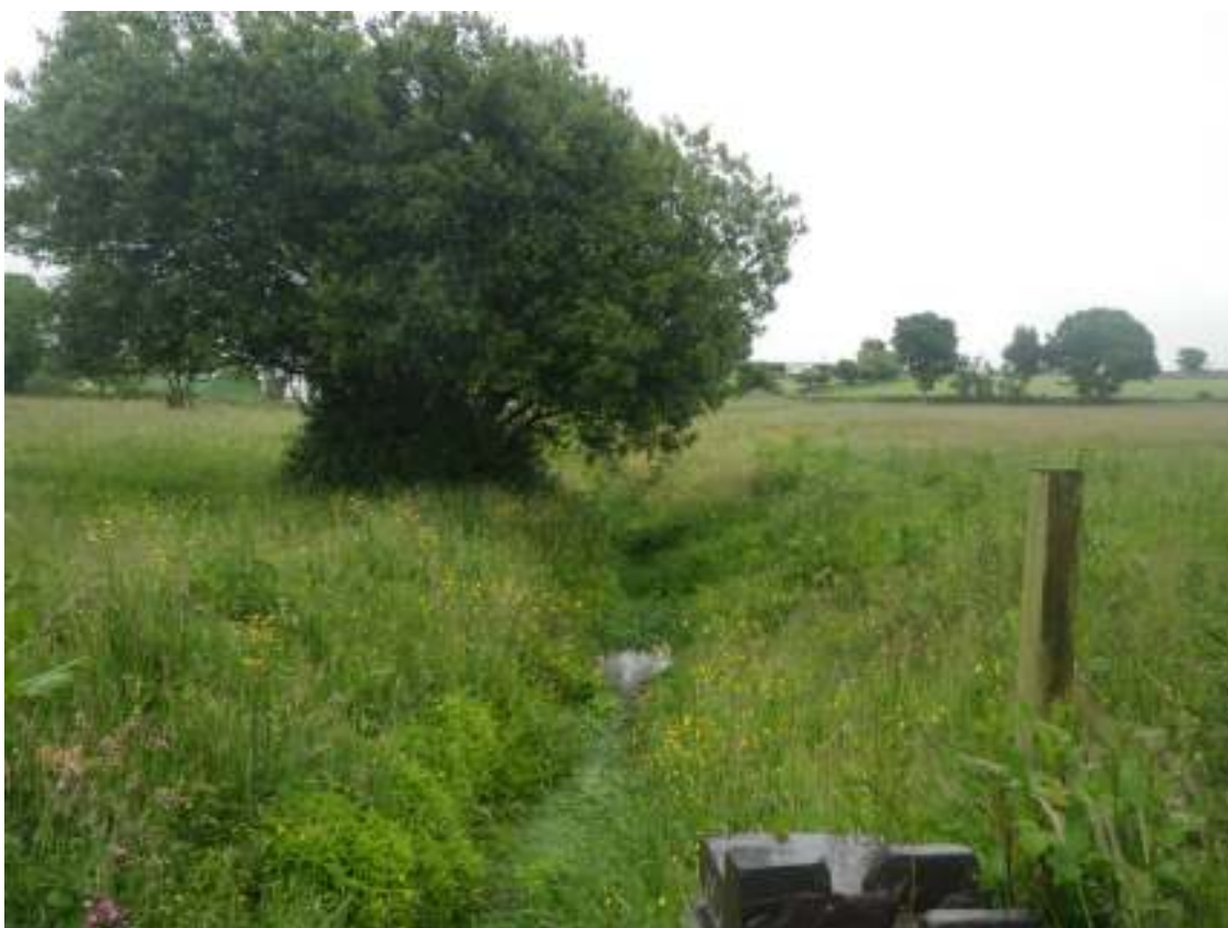
Cae 3 (ger y ffos)