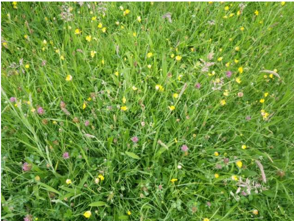
T58 Cae 3 (ger y ffos)