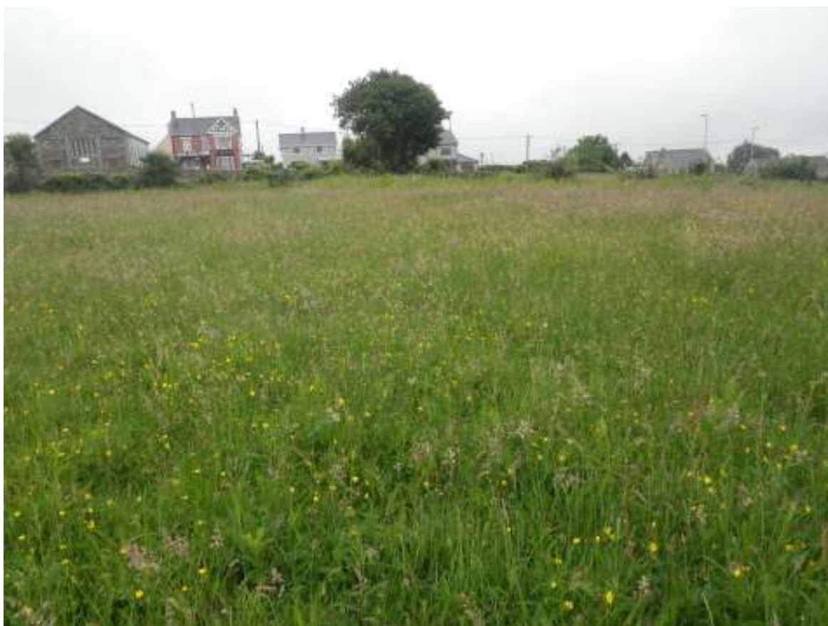
T58 Cae 2 (canol)