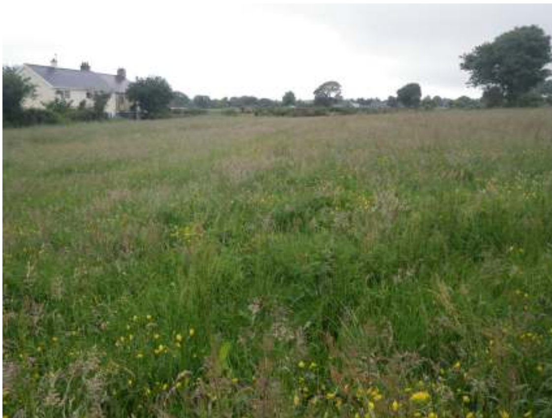
T58 Cae 1 (ger y lôn)