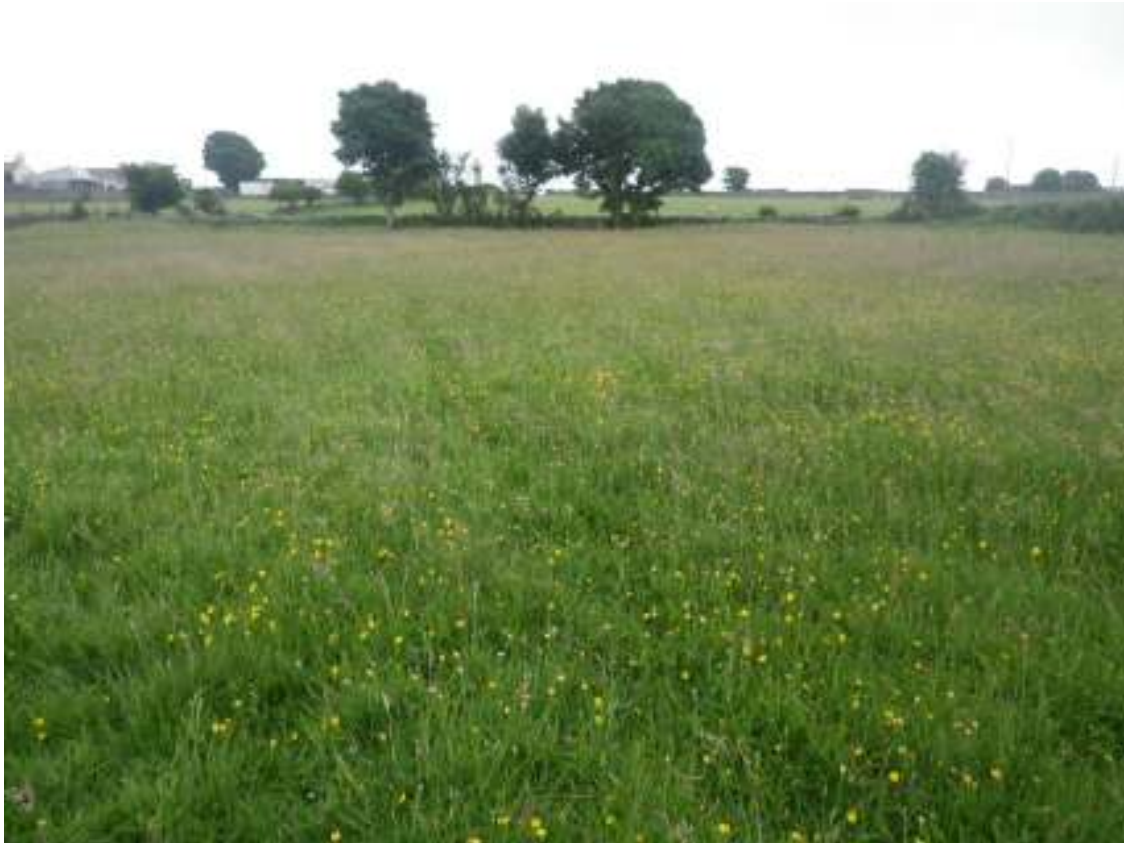
T58 Cae 3 ger y ffos