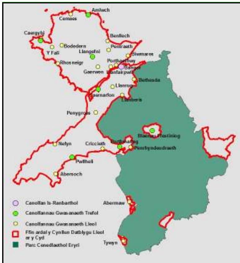
Map 1: Y Canolfannau sydd yn destun yr Astudiaeth Capasiti Trefol