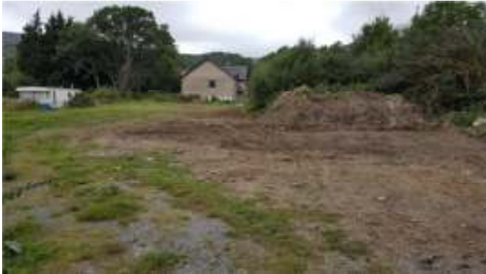
Y safle yn edrych i'r gogledd