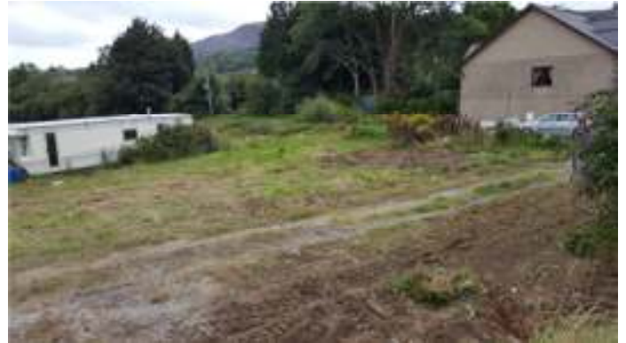
Yn edrych tua'r gogledd orllewin