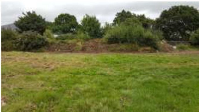
Yn edrych tua'r dwyrain