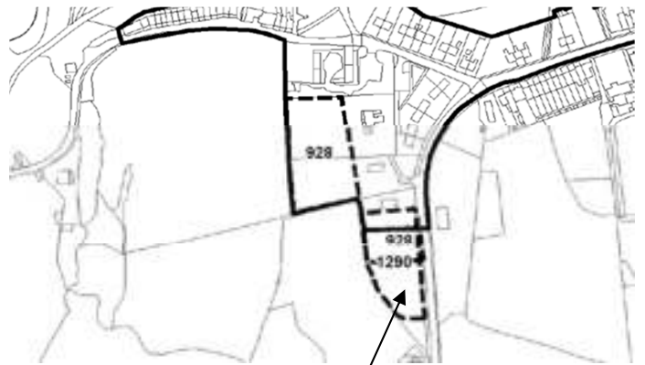
Safle amgen i'r de o Swn y Nant