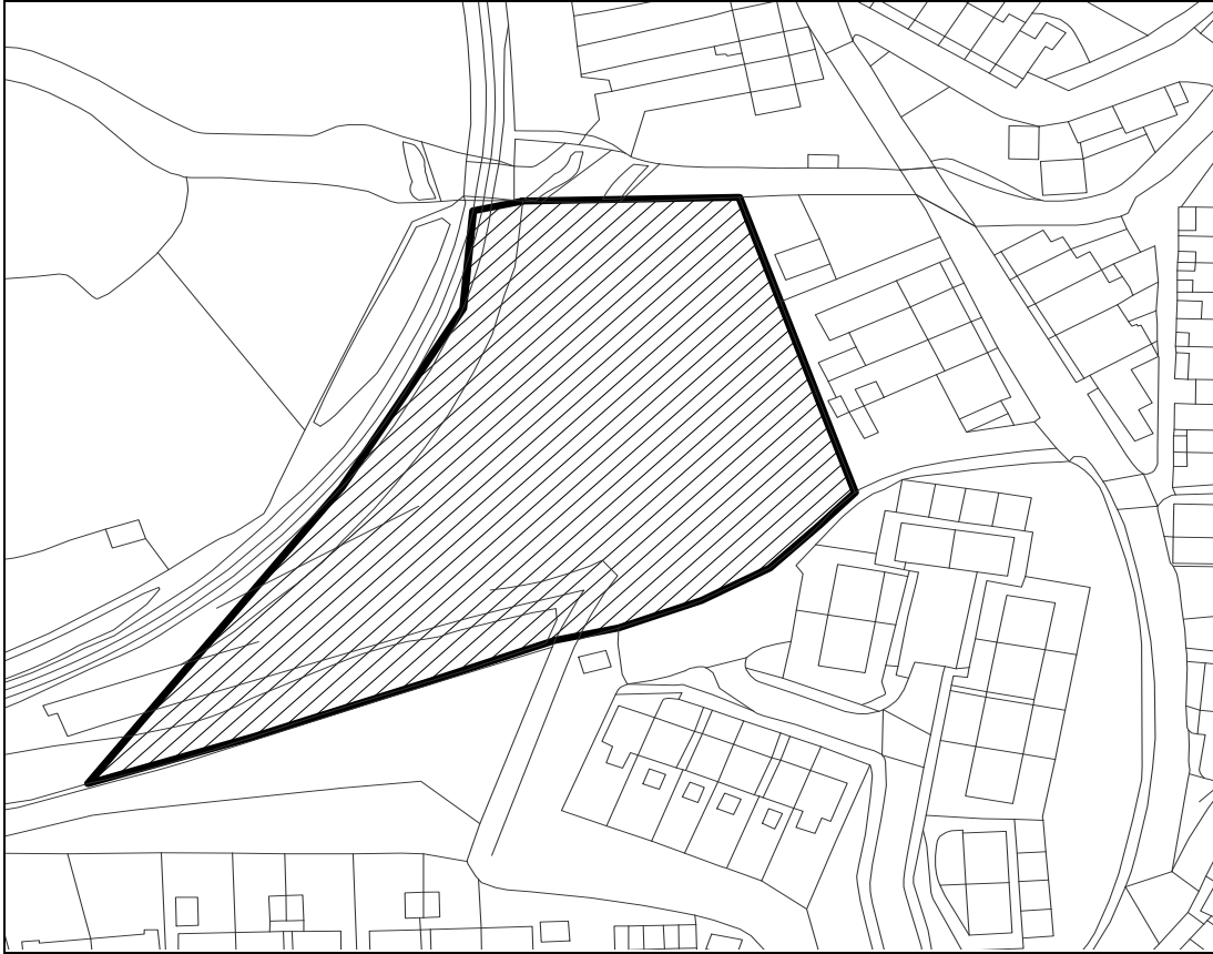
Map ddim i raddfa