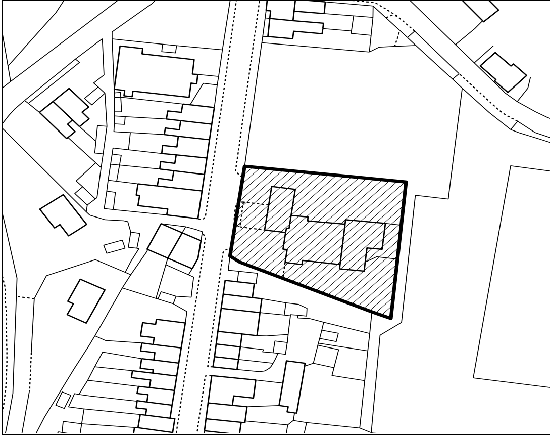
Map ddim i raddfa