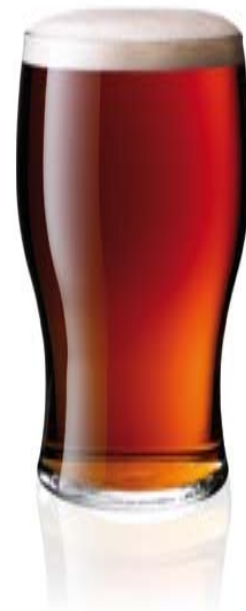
Tafarndai: Bydd y gyfraith ddi-fwg yn cwmpasu tafarndai a chlybiau

Cwmpesir llongau gan reoliadau a wneir gan Adran Drafnidiaeth y DU.