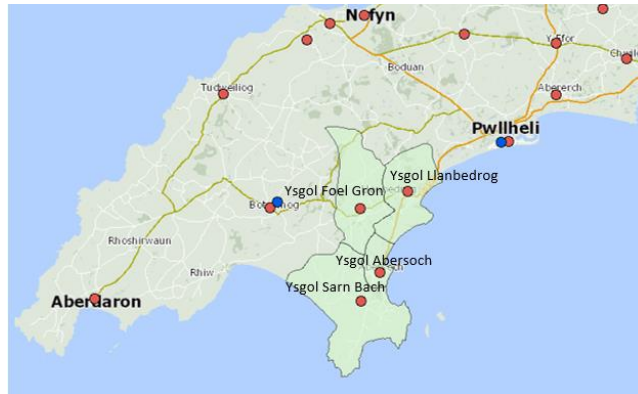
1 Lleoliadau ysgolion ardal Abersoch

Mae dalgylch Ysgol Abersoch yn ffinio gyda dalgylch 3 ysgol gynradd gyfagos, sef Ysgol Sarn Bach, Ysgol Foel Gron ac Ysgol Llanbedrog.