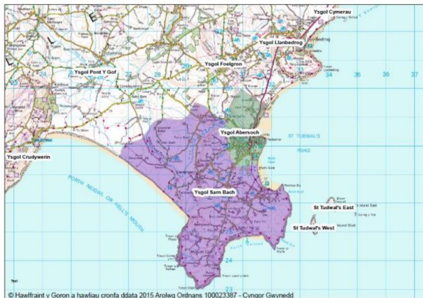
Map 1: Sefyllfa bresennol dalgylchoedd yr ardal

Pe byddai'r cynnig arfaethedig yn cael ei weithredu byddai dalgylch Ysgol Sarn Bach yn cael ei addasu i gynnwys ardal yr ysgol bresennol, yn ogystal ag ardal dalgylch presennol Ysgol Abersoch.